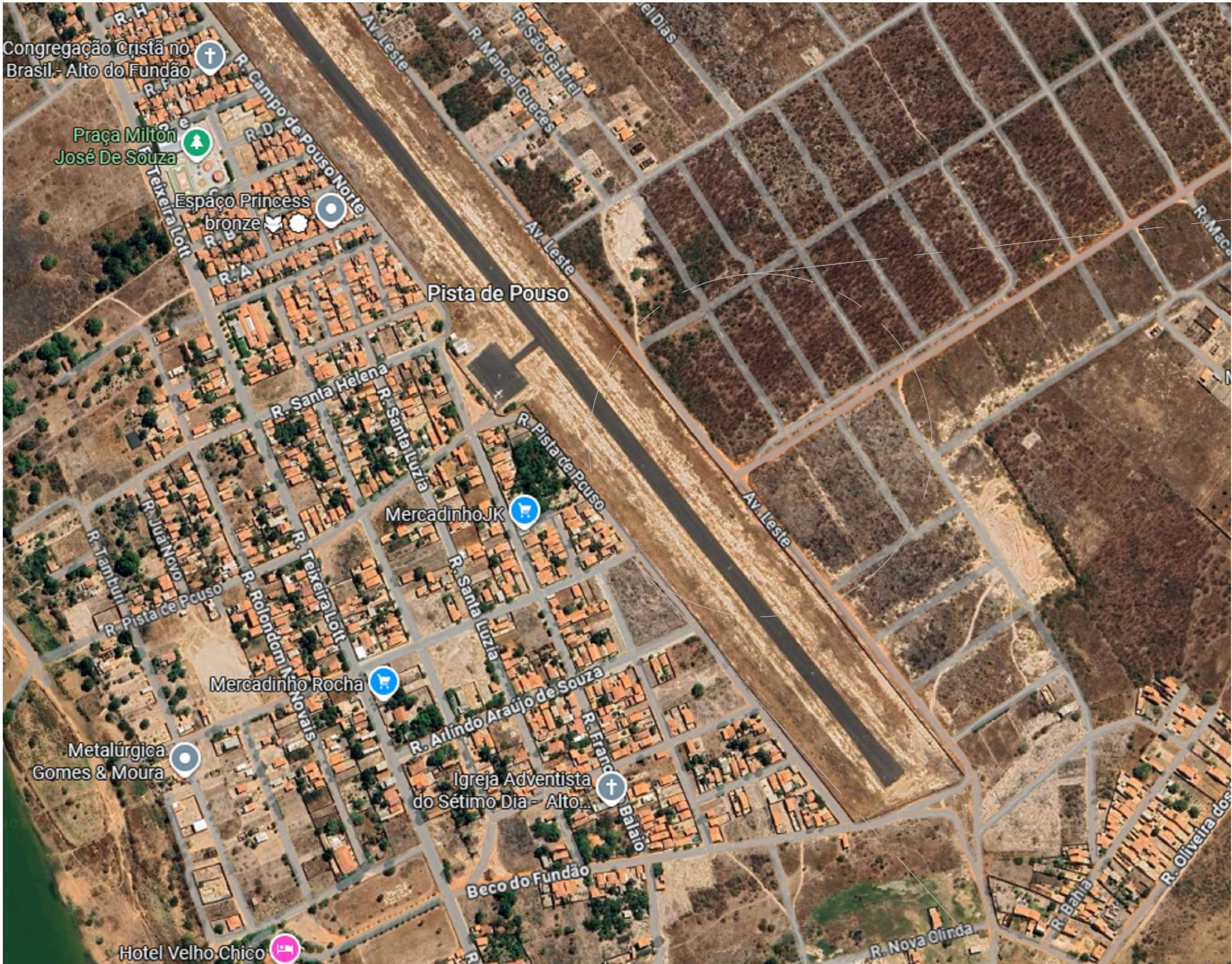
01 MAPA DA CIDADE ESC.: 1/5000